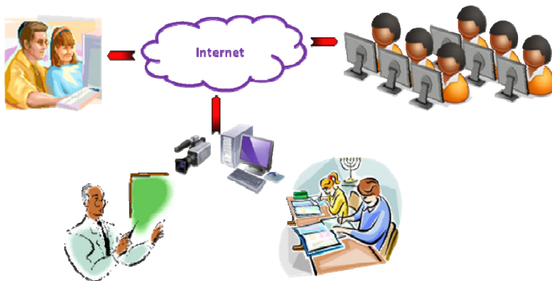
Obr. 1: Možnosti uplatnenia video-streamingu v pedagogickom procese.

nevyžadujú vysokú priepustnosť dátových prenosov. Tento vývoj spôsobil, že dátové toky prenášané prostredníctvom internetu umožňujú prácu v reálnom čase. Preto je našou snahou v tejto oblasti práve podpora video-streamingu.